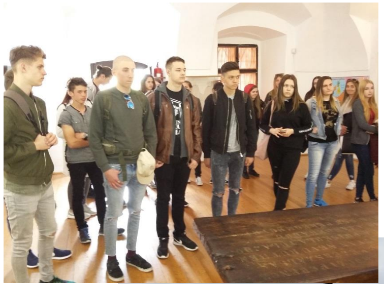
1. és 2.kép